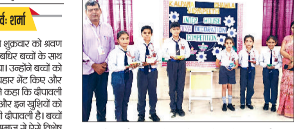
खरखोदा। दीया बनाओ प्रतियोगिता के विजेता विद्यार्थी।