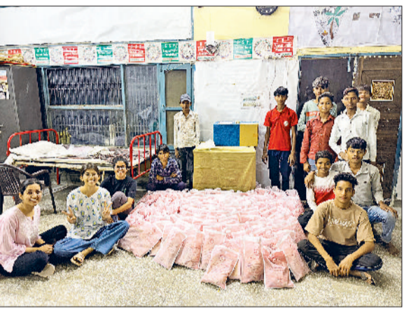
सोनीपत। गिफ्ट पैक करते फाउंडेशन के पदाधिकारी एवं सदस्यगण।