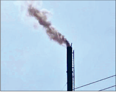
हरिभूमि न्यूज सोनीपत

सर्दी की दस्तक के साथ ही दिल्ली-पनसीआर के साथ सोनीपत की हवा भी जहरीली होती जा रही है, मगर विडंबना यह है कि जिले में वायु प्रदूषण मापने वाला एयर क्वालिटी मॉनिटरिंग सिस्टम (एक्यूएमएस) पिछले एक साल से बंद पड़ा है। जबकि जिले में ग्रेडेड रिसॉन्स एक्शन प्लान (ग्रेप)-1 लागू हो चुका है। ऐसे में प्रशासन और प्रदूषण नियंत्रण बोर्ड के पास हवा की वास्तविक स्थिति का कोई सटीक डेटा नहीं है।