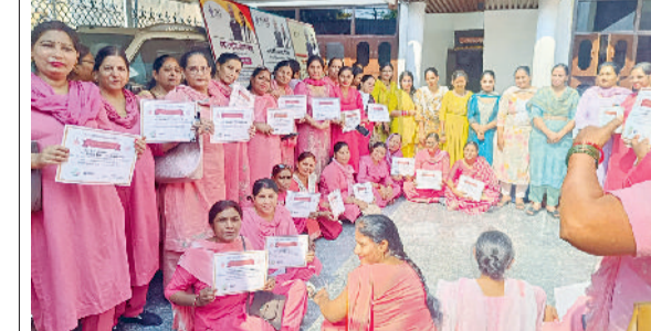
सोनीपत। प्रमाण पत्रों के साथ आंगनवाड़ी कार्यकर्ता।