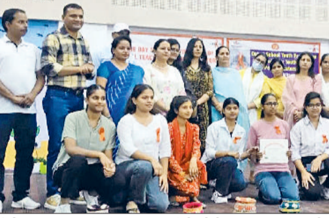
सोनीपत। कार्यक्रम के दौरान हिस्सा लेती जीवीएम गर्ल्स कॉलेज की छात्राएं।