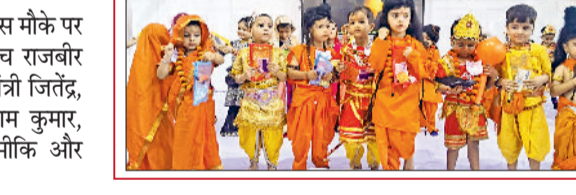
रामायण के पात्रों की वेशभूषा में गीता विद्या मंदिर के विद्यार्थी।