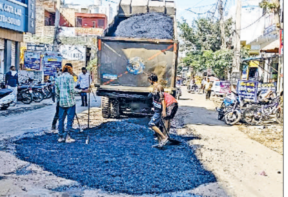
गजराज मार्ग पर दोषपूर्ण खंड की मरम्मत करते एजेसी के कामगार।

हरिभूमि न्यूज गोहाना नगर परिषद (नप) अधिकारियों की सख्ती के बाद एजेसी ने गजराज मार्ग पर मरम्मत शुरू करवा दी है। एजेसी ने दोषपूर्ण सड़क खंड को उखाड़कर वहां पर नए सिरे से रोड़े बिछाकर बिटुमिनस की लेयर बिछानी शुरू कर दी है। अधिकारियों ने एजेसी से मरम्मत के बाद मैटेरियल टेस्ट रिपोर्ट भी मांगी है। इसके साथ नगर परिषद द्वारा इस मार्ग पर लगाई गई