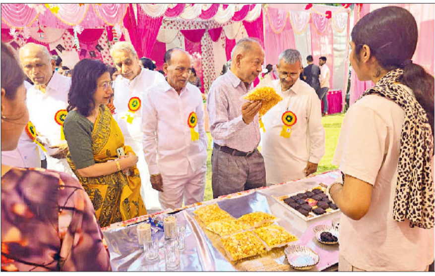
सोनीपत। हिंदू शिक्षण महाविद्यालय में मेले के दौरान संस्था के पदाधिकारी एवं सदस्यगण।