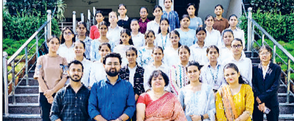
सोनीपत। प्रतिभागी छात्रों के साथ वक्ता एवं अन्य।