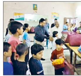
सोनीपत। मूक बहिर बच्चों को उपहार वितरित करते कृषि उपनिदेशक।