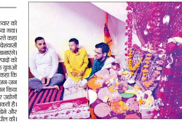
सोनीपत। प्रभात फेरी के दौरान भजन कीर्तन करते हुए श्रद्धालु।