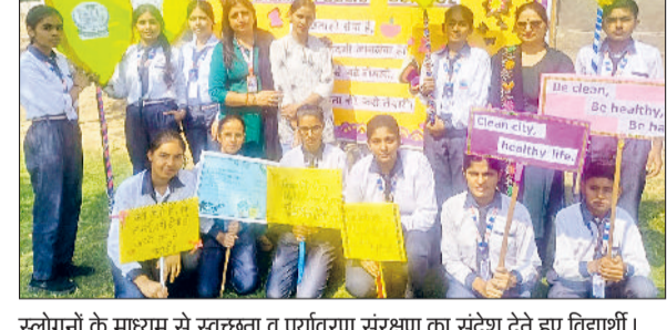
स्लोगनों के माध्यम से स्वच्छता व पर्यावरण संरक्षण का संदेश देते हुए विद्यार्थी।